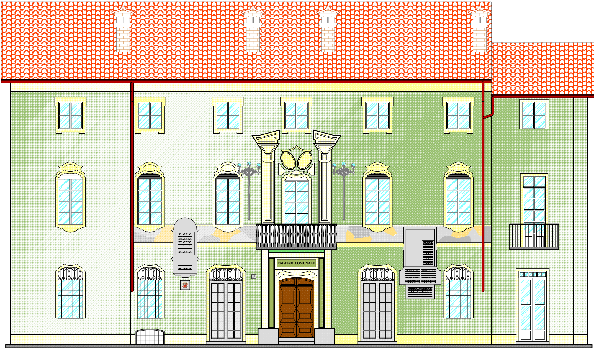
PROSPETTO NORD ESISTENTE scala 1:100