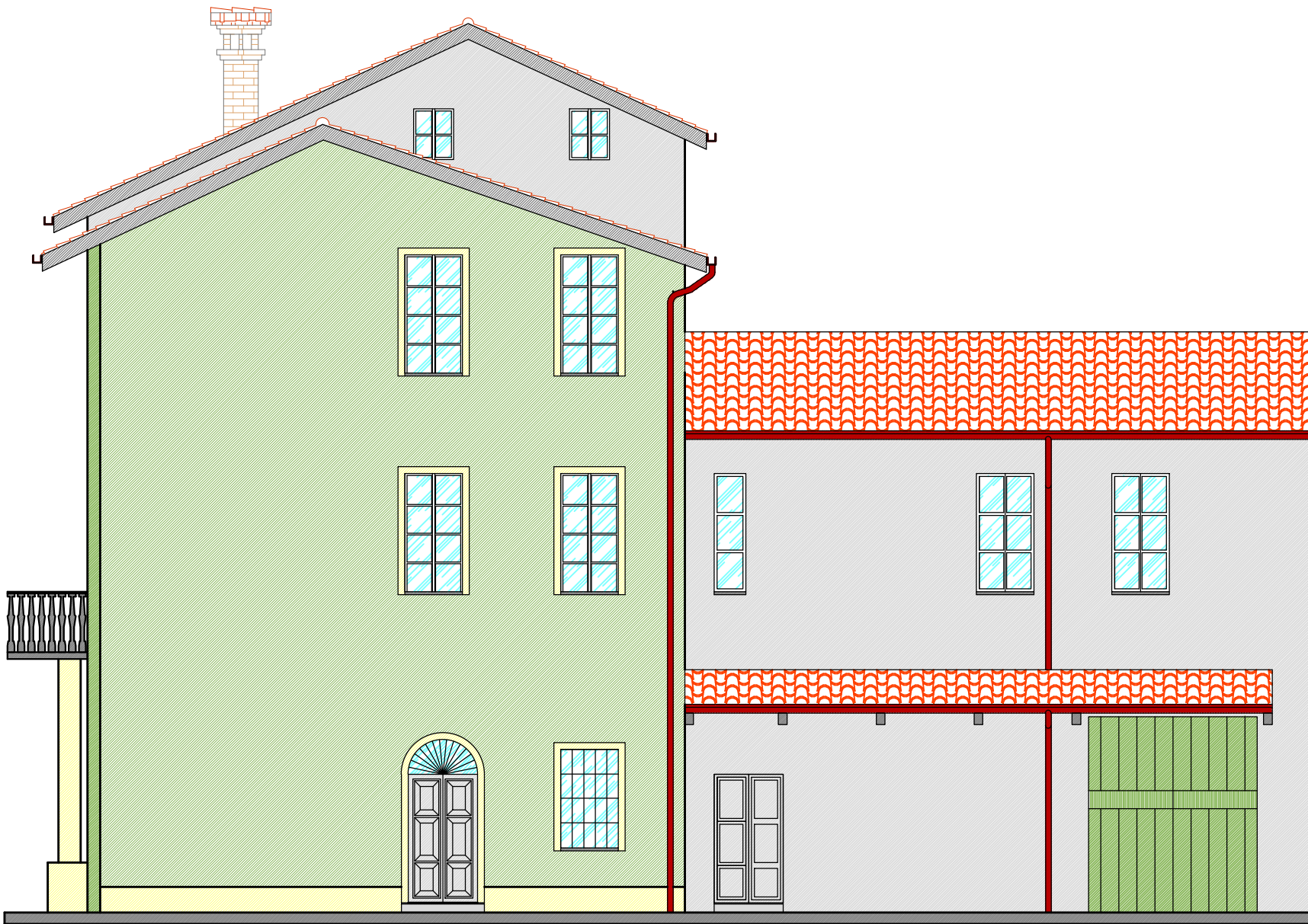
PROSPETTO OVEST ESISTENTE scala 1:100